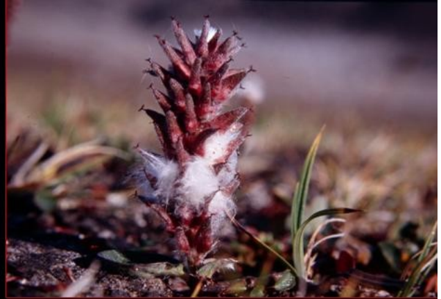
Campionamento della flora Artica: