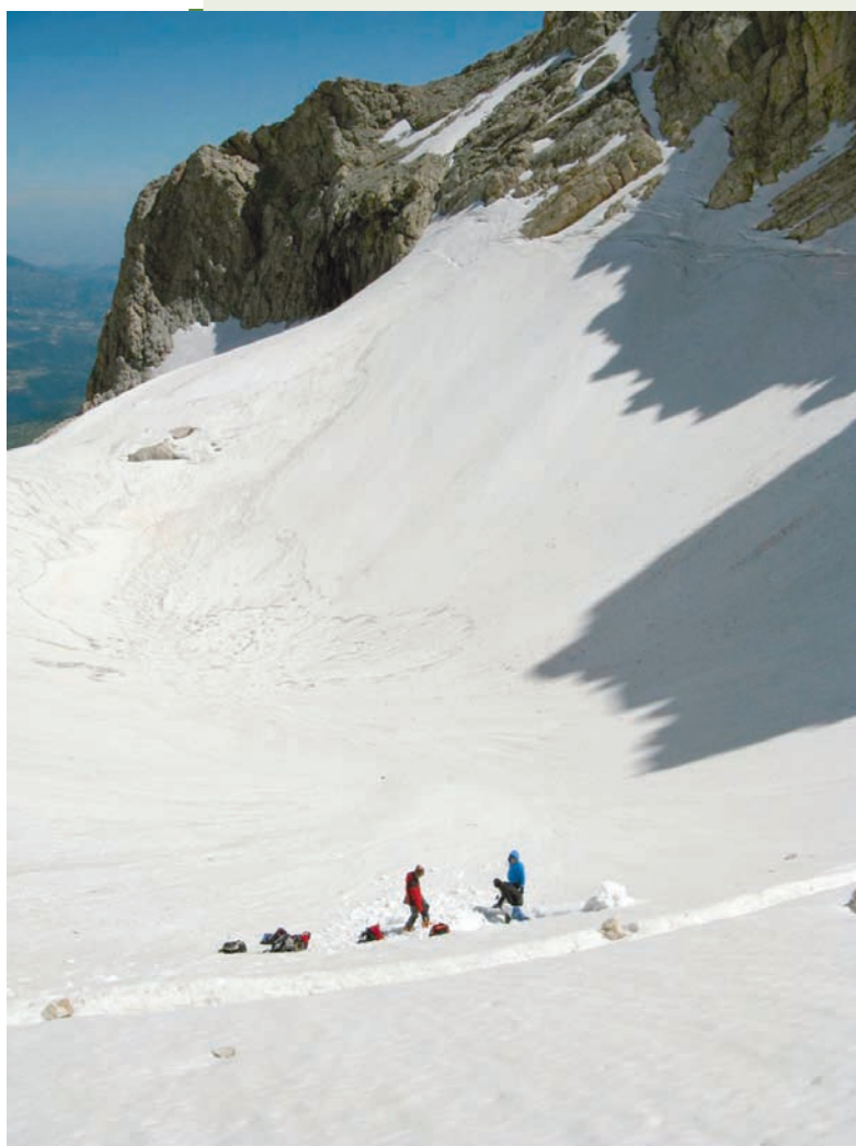
Fig. 3 – Rilievi nivologici e glaciologici sul Ghiacciaio del Calderone nel giugno 2009, completamente riempito di neve, come da tempo non si verificava.

Il Ghiacciaio del Calderone (Fig. 3) e i nevai perenni rappresentano degli elementi di grande interesse crio-ambientale, in quanto si stanno rivelando indicatori molto sensibili e reattivi al cambiamento climatico globale.