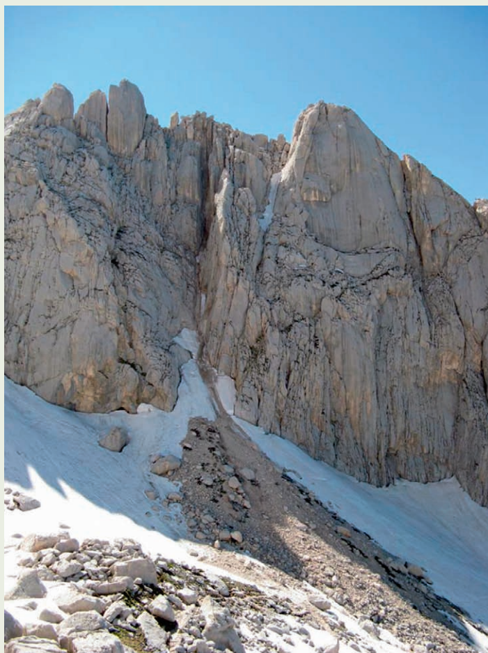
Fig. 7 – Parete Est del Corno Piccolo del Gran Sasso d'Italia; accumulo di crollo (fascia più scura, al di sopra della neve) indotto con molta probabilità dal sisma del 6 aprile 2009 e tuttora attivo: è ben visibile la superficie di distacco e il canale di scorrimento.

Da una parte l'Ente potrebbe farsi promotore e coordinatore di un "polo di ricerca sul Gran Sasso d'Italia" che abbia lo scopo di rendere operative le sinergie tra mondo della ricerca e espressioni territoriali (pubbliche e private) in maniera tale da razionalizzare gli sforzi e far rendere i pochi fondi per la ricerca disponibili nella maniera migliore, a cominciare dalla promozione della sicurezza ambientale; dall'altra (ma contemporaneamente) credo che sia arrivato il momento di proporre la candidatura del Gran Sasso d'Italia come Patrimonio dell'Umanità presso l'Unesco: per la sua unicità come laboratorio naturale, come straordinario modello naturale e didattico di evoluzione geomorfologica e ambientale e come montagna identitaria: in sintesi come montagna che unisce, soprattutto dopo la terribile esperienza del terremoto.