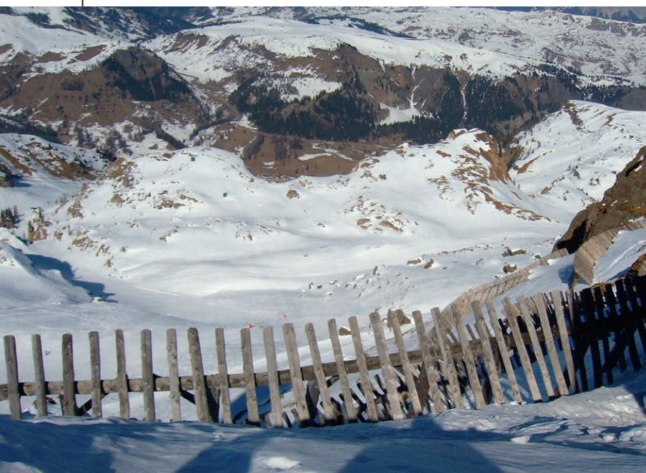
Fig. 1 – Opera di difesa dalle valanghe per la sicurezza dei comprensori sciistici.

È il caso delle valanghe provocate da sciatori e sci-alpinisti che coinvolgono anche gli sfortunati malcapitati a valle (oltre a creare danni alle strutture e infrastrutture) o di incidenti o di fatali scivolate che si ripercuotono, coinvolgendoli, anche sui compagni di cordata più in basso.