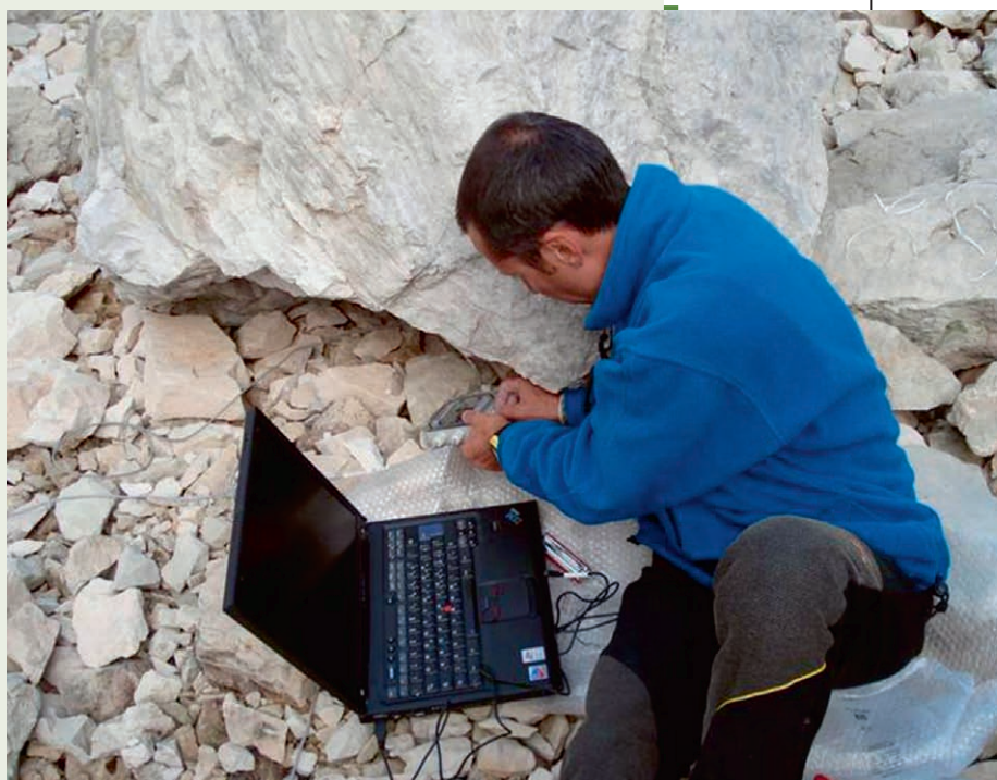
Fig. 4 – Rilevamento dei dati di temperatura dalla centralina di monitoraggio dell'EIM in prossimità del rifugio "Carlo Franchetti", sul Gran Sasso d'Italia.

La presenza di queste forme simili a festoni, lobi e cordoni che si evidenziano su un accumulo detritico in deformazione su debole pendenza, come a valle del nevaio in questione (Fig. 6), sono tipiche dei rock glacier attivi e, unitamente al segnale registrato dalla sottostante centralina di monitoraggio della