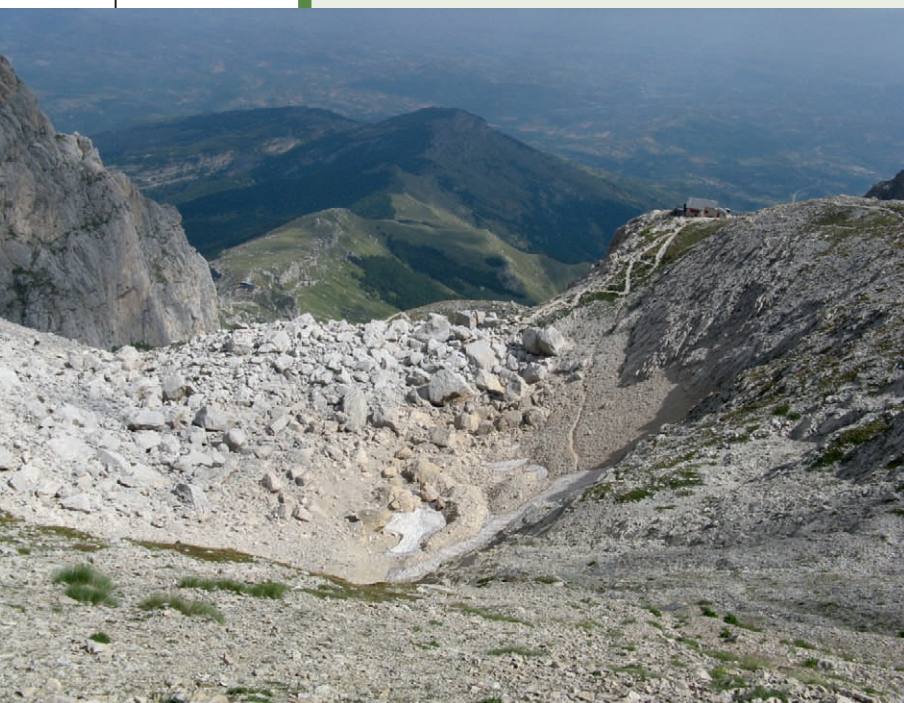
Fig. 6 – Panoramica dell'area presso il rifugio "Carlo Franchetti": in corrispondenza del nevaio è ubicata la centralina di monitoraggio dell'EIM e sono visibili le forme caratteristiche a lobo e a festone.

Questo dovrebbe essere l'atteggiamento da tenere per il futuro non ancora conosciuto del Ghiacciaio: elasticità e vivacità culturale e scientifica che sia in grado di coniugare gli studi più approfonditi con le grandi dinamiche planetarie